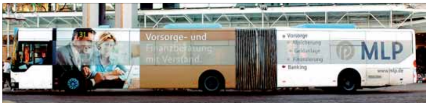
Solche Werbung, die alle Scheiben verdeckt, soll es nicht wieder auf Heidelbergs Bussen und Bahnen geben, verspricht die RNV.

RNV beugt sich dem Wunsch der Stadt und verzichtet auf großflächige Werbung